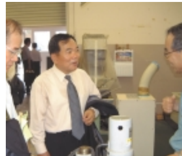
千葉工業大学との技術交流会

三、中小・小規模企業の経営基盤強化支援事業の充実 中小・小規模企業の経営基盤の強化安定に資するべく、