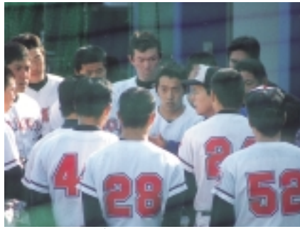
監督のゲキに選手の緊張感も高まる

まずは開幕の2、3試合で勝ち点を確保し勢いをつけ、優勝争いに食い込んで欲しい。この大学も実力的には紙一重なので、終盤戦の一番での精神力が優勝の分かれ目ではないだろうか。(岡)