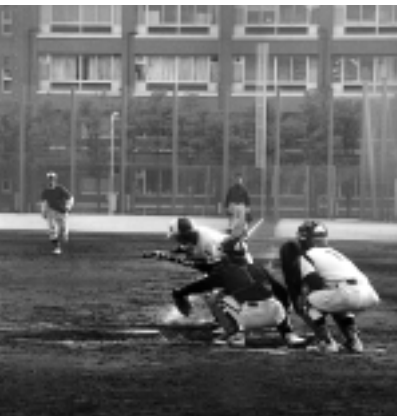
「がんばれ日大野球部」（3面から）

今年度の特集記事は、スポーツに関わりのあるスポーツ（野球、サッカー、相撲、ゴルフ、陸上など）を取り上げていきます。会員の皆さんが「のびのび、お楽しみ」に。