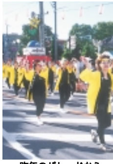
昨年のパレードから