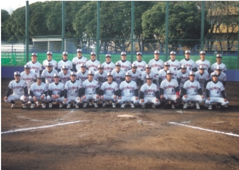
監督、コーチ、選手が一丸となり、悲願の優勝を目指します