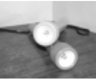
(有)ベネフィット提供