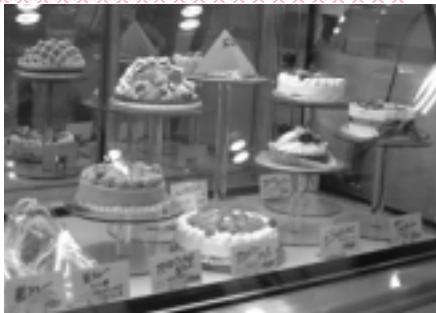
店内はおいしいケーキでいっぱい