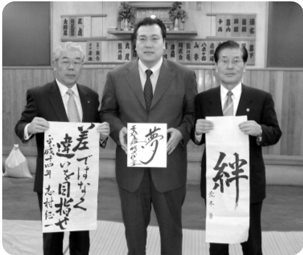
お互いの目標の実現を誓い合う