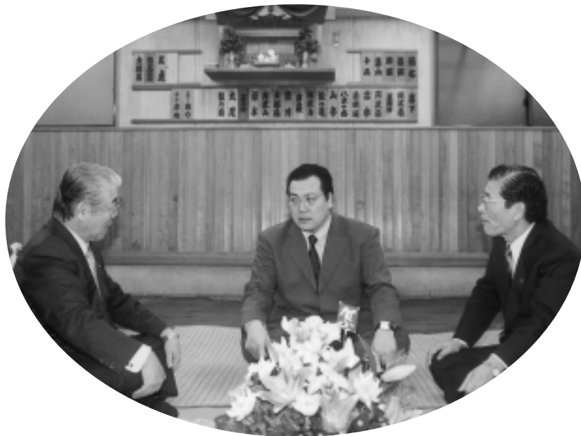
習志野から初の横綱力士が誕生するのはいつ？