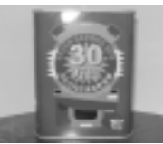
(有)ベネフィット提供