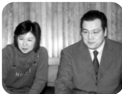
二人で力をあわせて(おかみさんはプロゴルファー)