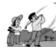
(有)習志野カントリークラブ空港コース