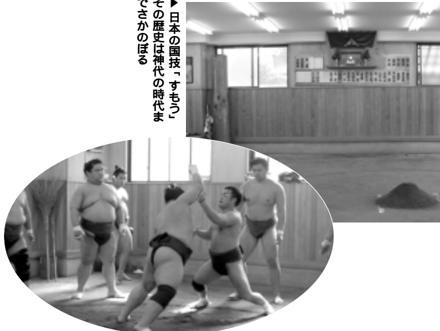
▶日本の国技「すもう」その歴史は神代の時代までさかのぼる