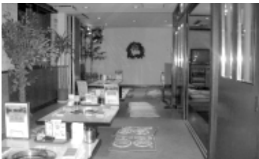
広い店内はゆっくりくつろげます

営業時間: 平日11時30分~14時、17時~23時 休日11時30分~22時 定休日: 月曜日(祝日の場合は営業)