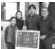
(有)高山写真館提供

(有)高山写真館(津田沼1-2-11 ☎472-3200)様のご提供により、就職用証明写真割引券(ヘアメイク付)を5名様に。その他、パスポートや各種証明写真にもご利用できます。 (有)習志野カントリークラブ空港コース(香取郡山田町小川1-37-1 ☎0478-79)2111)様のご提供により、メンバー料金ブレイク券(1名無料、同伴者メンバー料金)を2名様に。