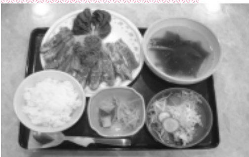
徳用セット(1100円〜)はボリューム満点!

(有)高山写真館(津田沼1-2-11 ☎472-3200)様のご提供により、就職用証明写真割引券(ヘアメイク付)を5名様に。その他、パスポートや各種証明写真にもご利用できます。 (有)習志野カントリークラブ空港コース(香取郡山田町小川1-37-1 ☎0478-79)2111)様のご提供により、メンバー料金ブレイク券(1名無料、同伴者メンバー料金)を2名様に。