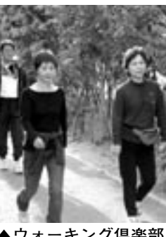
▲ウォーキング倶楽部

9月17日(水)午前10時～商工会議所会館にて開催。 主な議題・商店街デジタルマップ作成について他