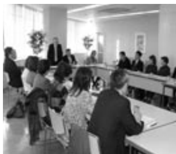
▲▼昨年の会議から (上：津田沼・下：谷津地区)