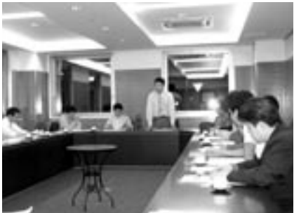
▲例会では活発な意見交換が行われる

員拡大を図っています。新しい同志が加わった青年部では、今後もフリーマーケット(11/24開催)への飲食部門での出店や、経済セミナーなどの研修事業を予定しております。皆様のご参加をお待ちしております。