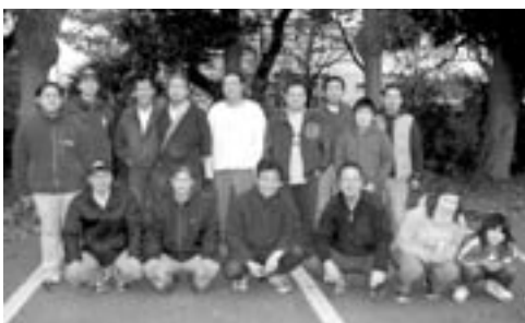
ただいま、青年部員募集中!

トが開催されました。当青 年部は共催として飲食コー ナーで豚汁や唐揚げを販売 し、晩秋の寒空の中、多く の来場者で賑わう会場の憩 いの場を提供しました。 今後は、経済セミナーな どの研修事業を予定してい ます。皆様のご参加・ご来 場をお待ちしています。