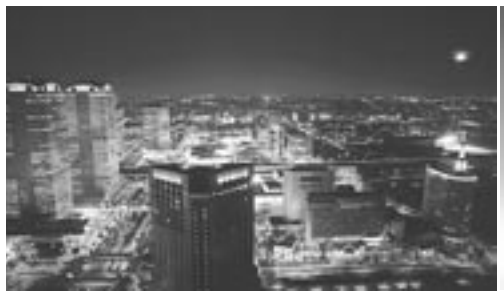
高層階から見た夜景「ダイヤモンドビュー」と記念のオリジナルカクテル (50 Fラウンジ・トップオブマクハリにて)

この季節はクリスマスや正月を控え、お客様がより楽しい時間を過ごせるようにと、恒例となっているクリスマスパーティー、カウントダウンパーティー、忘年会や特別宿泊プランをはじめ、各レストラン・ラウンジではとれたて新鮮素材をたくさん使った「冬の東