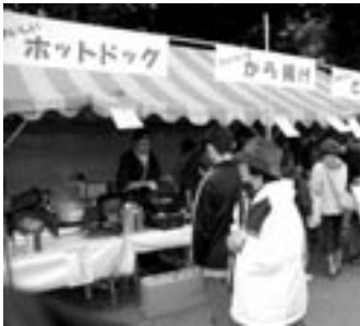
▲テント内で販売する青年部員

トが開催されました。当青 年部は共催として飲食コー ナーで豚汁や唐揚げを販売 し、晩秋の寒空の中、多く の来場者で賑わう会場の憩 いの場を提供しました。 今後は、経済セミナーな どの研修事業を予定してい ます。皆様のご参加・ご来 場をお待ちしています。