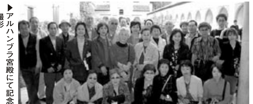
▶アルハンブラ宮殿にて記念撮影

テルのロビーであれ、レストランであれいたるところに灰皿が置いてある光景にほっとしました。スペイン第三の都会セビリヤで、女性の方々のショッピングのお付き合いで町最大のデパートに行きました。日本のデパートと変わりのないさまざまなファッションの陳列と磨かれた床の婦人服売り場で、歩き疲れ、所在無くうろうろ喫煙所を捜しましたがどこにも見当たりませんでした。さすがデパートは全館禁煙なんだと感心しながらやむなく屋外に出ようと思つたら、突然眼前の婦人服の影から若い男女がくわえタバコで現れました。