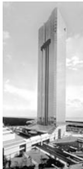
高層階からの眺めは最高！

「ブマクハリ」では、同名のオリジナルカクテルをご賞味いただけます。今年の冬はダイヤモンドのような輝きに包まれ、普段とは違う少しオシャレな夜を過ごしてみるのはいかがですか？