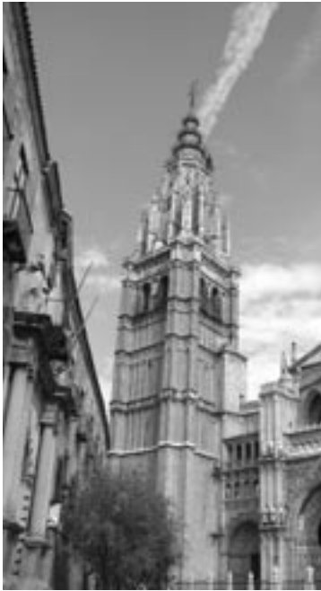
▲トレドのカテドラル