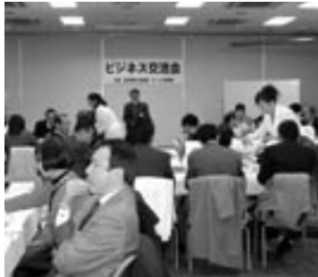
▲昨年のビジネス交流会から

11月20日(木)午後2時～商 工会議所会館3階にて開催。 信用保証制度の現状と課題に ついて、千葉県信用保証協会