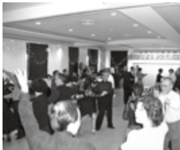
▲チャリティーダンスパーティー