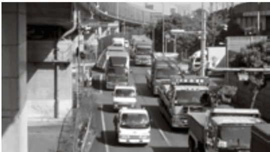
▲国道357号線(若松付近上り)の慢性的な交通渋滞

産業や都市集積が著しい千葉県湾岸地域を東西に結ぶ国道357号線は、これに接続する県道船橋海浜線や船橋我孫子線などからの交通も担い、船橋市、習志野市の産業経済の発展に欠くことのできない重要な幹線道路として機能し