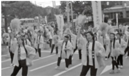
▲「きらっと習志野2005」パレード風景