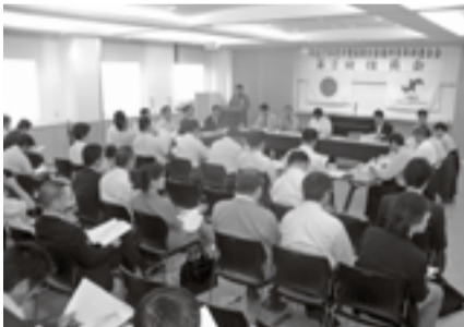
▲県内の若手青年経済人が一堂に会す

役員会終了後はそのまま懇親会を開催し、他地域の同世代の若手青年経済人と交流し、青年部事業や自身の事業について幅広く情報交換をおこないました。