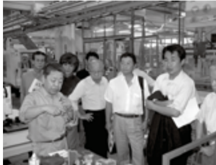
▶ 工作センターの見学風景

本年、習志野市から受注して開催した産学官プラットフォーム。8月9日(火)に産学技術交流会において、千葉工業大学との交流事業を行いました。