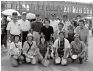
▲万博会場を背にして

境改善のムードの中、グローバル化の進展に伴い「従業員にも国際感覚を」という趣旨から実施されました。当日は全国から約15万人の来場があり、開催期間中も予想を上回る来場者数があるなど興行的には大成功に終わったといわれますが、紙コップやプラスチックの使い捨て容器が多様化されているなど「環境保護」の視点から見る、多少疑問に残る点もあるとの声も聞こえました。