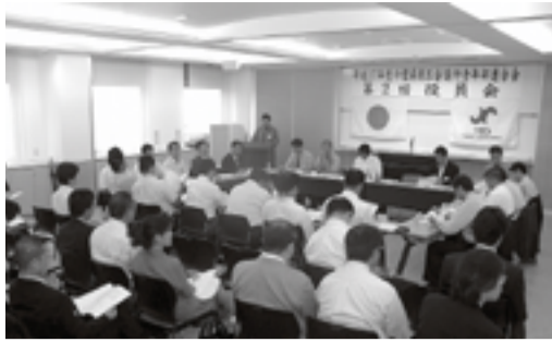
▲県青連役員会風景