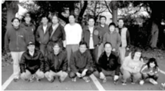
▲市内の若手青年経済人が共に集う

今回の開催を終え国民の意識が通常よりも多く「環境保護」に向けられました。この成果を今後、どのようにして普段の生活や事業活動に継承して行くかが今後の課題と思われれます。