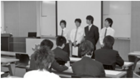
▲最終日の報告会風景

習志野商工会議所では、日本大学生産工学部と連携して、8月29日から10日間のインターンシップ(学外実習)を行いました。