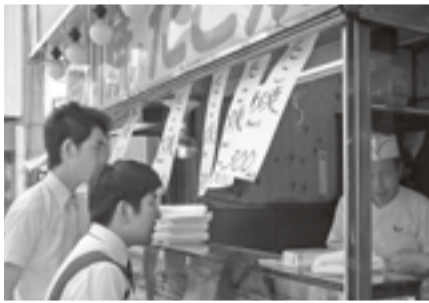
▲学生自身が直接事業主に説明を行う

また、郵便局からの口座振替もご利用いただけるようになりますので、ご希望される場合は、経営室(452)6700までご連絡いただけますようお願い申し上げます。