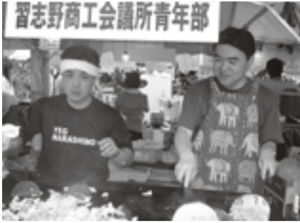
▲市内のイベントへの参加を通じ地域振興を行う

7月・きらっと習志野への参加（実施済み）、11月商連フリーマーケットへの参加、12月・研修会、2月・家族交流会