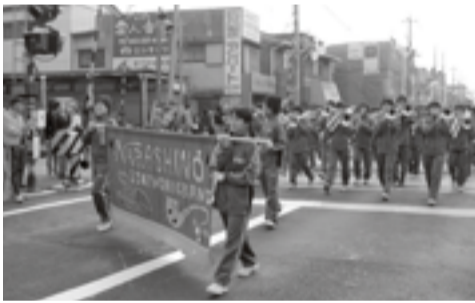
▲市立習志野ブラスバンド部のパレード

去る11月3日(水)文化の日 に大久保地区で収穫祭、実 籾地区でふるさと祭が開催 されました。