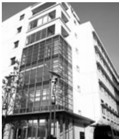
▲東邦大学理学部ハイテクリサーチセンター

日時Ⅱ平成17年11月18日（金） 午後1時50分～ 集合場所Ⅱ東邦大学理学部V号館1階5104教室 午後1時50分（京成大久保）