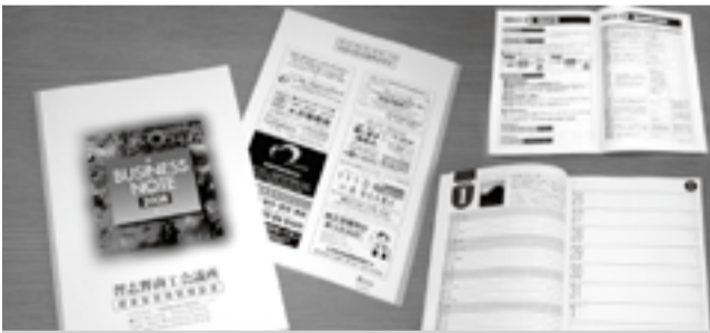
ダイアリー、金融・共済制度、経営に関する情報などが載ってとっても便利