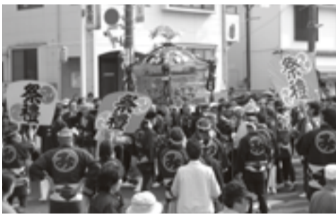
▲商店街をねり歩く大原神社の御輿