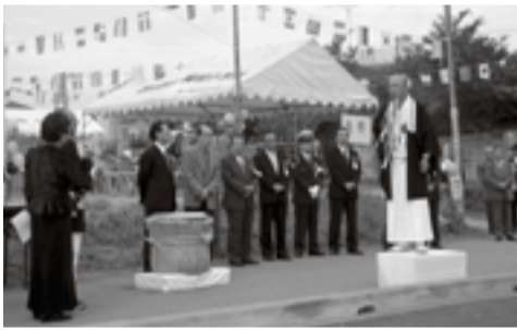
▲拡幅事業竣工記念式典の風景