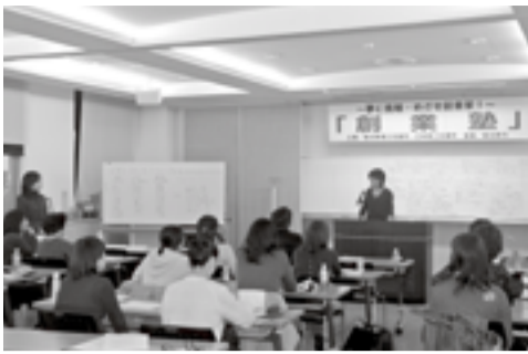
▲▼事業計画のプレゼンテーション（創業塾にて）

「天使の部屋」と描かれたトールペイントの看板を目印にガレージ越しに自宅を改造したブティックに入ると、店内は6畳ほどのスペースに婦人服がディスプレイされ、ショッピングに来たというよりも部屋に招かれたという印象を感じる隠れ家的でユニークなお店です。