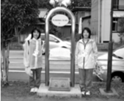
▲ 千葉県ウォーキング協会の皆さん