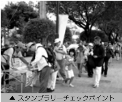
▲ スタンプラリーチェックポイント