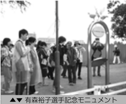
▲▼ 有森裕子選手記念モニュメント