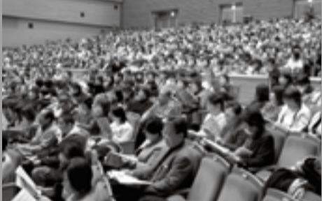
▲1,227名の来場者で賑わう