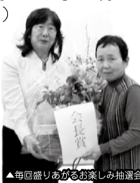
▲毎回盛り上がるお楽しみ抽選会