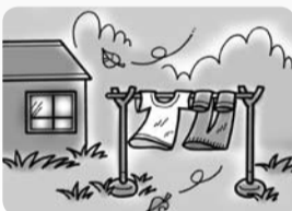
洗濯物が何日も干しっぱなしになっている

ちょっと変だな...大丈夫かな...と思ったことを地域包括支援センターまでご連絡ください!