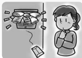
郵便物や新聞が何日も郵便受けにたまっている