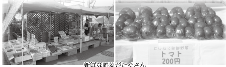
新鮮な野菜がたくさん

谷津サンプラザ商店街が、5月14日(土)に、第1回「プラザ朝市」を谷津駅前広場で開催しました。本事業は、商店街施設を活用しながら商店街と地域コミュニティの再生や賑わい、地産地消を促進しようと始められたもので、当日は晴天のなか、地域の事業者やJAの協力により各テントの軒先に並べられた地元産の新鮮なトマトやネギなどを、地域の住民や通りがかった人々が足を止め、興味深そうに手に取る姿が見られました。 今後の開催については、谷津サンプラザ商店街にお問い合わせください。 TEL: 047(476)4575