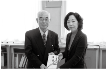
▲(社)習志野市社会福祉協議会 海資会長に直接寄付