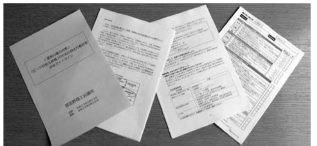
▲「ピーク抑制&節電」のための自主行動計画作成ガイドライン