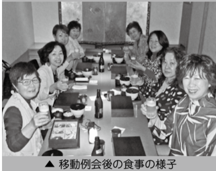
▲移動例会後の食事の様子