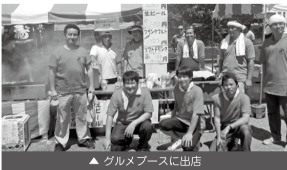
▲ グルメブースに出店

今年の市民まつりは、震災後ということも、例年よりも規模が縮小されましたが、多くの来場者で会場は埋め尽くされ、午後に入ると「塩焼きそば」も完売となりました。今回の出店での売り上げは、東日本大震災の義援金として寄付を行う予定です。 青年部では、今後も年間を通じて様々な事業活動