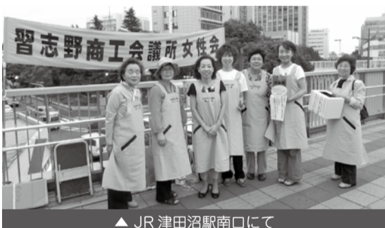
▲ JR津田沼駅南口にて