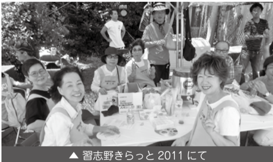
▲ 習志野きらっと2011にて

マルケイ融資をご利用ください「年利1.95%で1千五百万まで（7月28日現在）。無担保・無保証人」