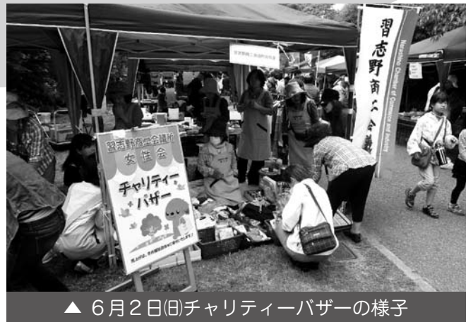
▲ 6 月 2 日(日)チャリティバザーの様子

今年、ラムサール条約 20 周年を迎えた谷津干潟。6 月 1 日(土)、2 日(日)に開催された「谷津干潟の日」において、当所女性会がチャリティバザーを行いました。