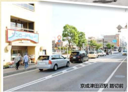
京成津田沼駅 踏切前