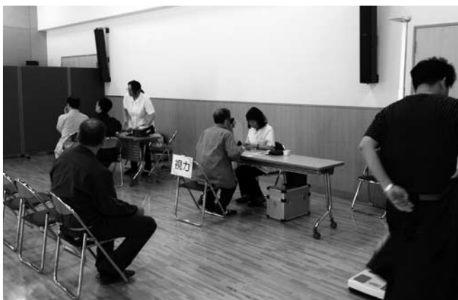
▲ 6 月 3 日(月)開催 会場: 茜浜ホール

5 月下旬～6 月上旬に巡回一般健康診断を開催し、118 事業所、717 人の会員事業者、従業員の方々が受診されました。巡回健康診断は会場を習志野商工会議所、茜浜ホール、東部体育館、谷津公民館の 4ヶ所設けることにより、最寄りの会場で受診できることから