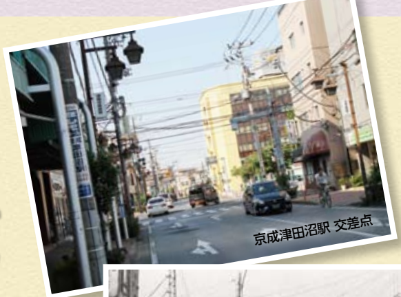
京成津田沼駅 交差点