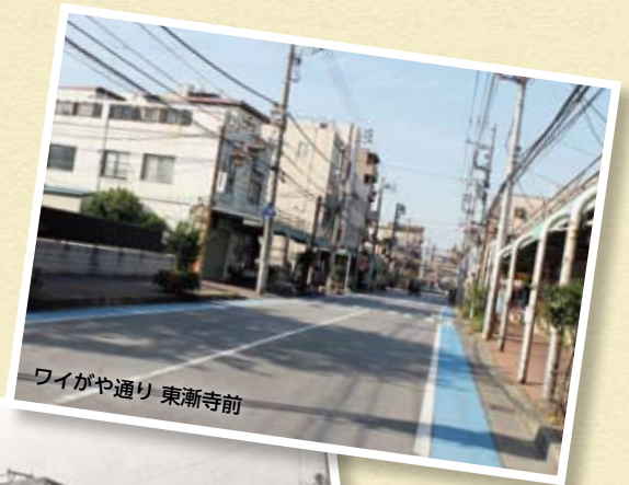
ワイがや通り 東漸寺前