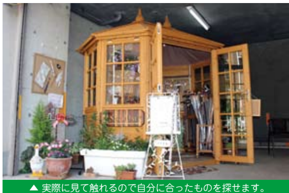
▲ 実際に見て触れるので自分に合ったものを探せます。

1番は人との繋がりでした。参加者同士で互いの悩みを相談したり、アドバイスを出し合ったりするなど、同じ創業という夢を持った仲間と出会えたことはとてもよかったと思います。今でも当時の方達と連絡を取ったり、時には仕事をお願いしたり、されたりなどとても良い関係を築けています。