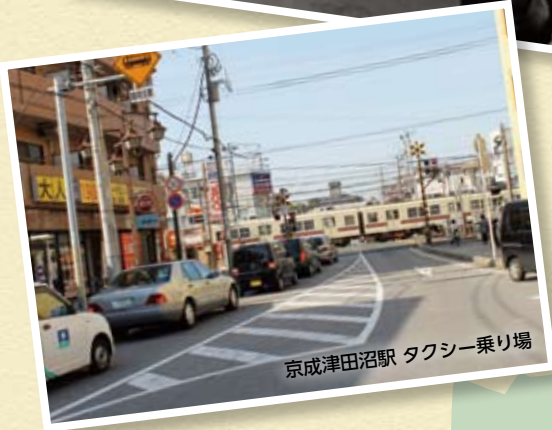
京成津田沼駅 タクシー乗り場