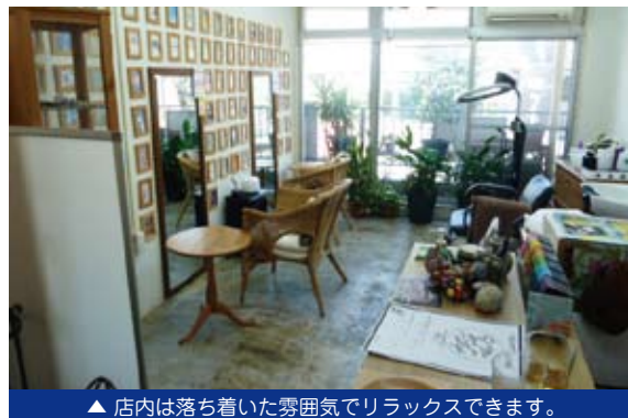
▲ 店内は落ち着いた雰囲気です。リラックスできます。

開業するにあたり、資金、事業計画書をブラッシュアップしてもらえました。思いつきで突き進むのではなく、戦略と道筋をしっかりと再確認できる場所となりました。また、出店するにあたり、同業のお店との差別化や、出店場所など講義で学んだ知識を基に計画をたてることができたと思います。