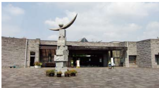
谷津干潟自然観察センター

今一度、ラムサール条約を見直し、長期的な谷津干潟の再生と利用戦略を構築し、住民、研究者、行政、そして企業が協働で再生の歴史を作ること、10年後あるいは50年後には谷津干潟が人と干潟のつながりを持つ習志野市の文化遺産として地域ブランドになるのではと思っています。