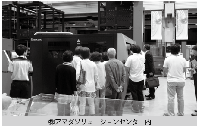
(株)アマダソリューションセンター内

から設計を一貫して行う開発センター、24時間対応の供給体制が整えられている機械業界最大のパーツセンター等の視察を行いました。