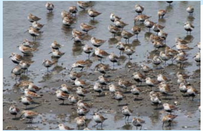
谷津干潟に現れるハマシギの群れ

した。これは地域が求めた谷津干潟ではありませんが、このような現状は人的問題から起こったものであり、自然そのものから派生したものではありません。逆に言えば、人的問題であるがゆえに、人的に解決していかなければならないこともあると考えています。ここでは、谷津干潟から得られる地域の恵みを今一度整理し、そのためには私たちは何をすべきかを考えてみたいと思います。