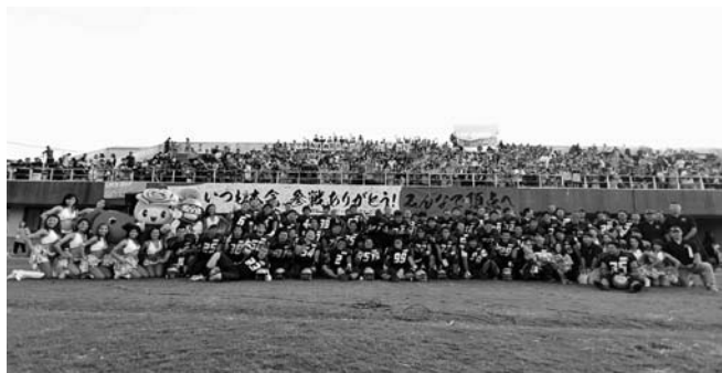
満員となった秋津サッカー場で記念撮影

2013 年秋季リーグ戦ファーストステージは現在 3 連勝中。4 年連続日本一を狙うオービックシーガルズの応援を今後もよろしくお願いします。