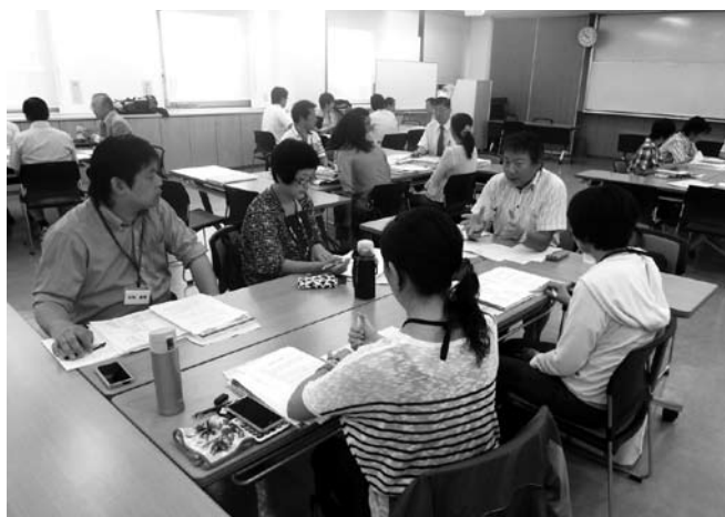
各グループに分かれてビジネスプランを作成

当所では、将来の地域産業を担う創業・開業志望者の育成を経済活性化の重点施策と位置付け、創業塾など体系的な講義を通して人や情報の交流ネットワークを育み、あわせて市民が市内で又は市外の方が市内での開業を選択できる魅力ある地域づくりと支援策の充実に取り組んでまいります。