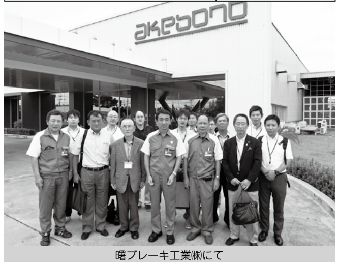
曙ブレーキ工業(株)にて