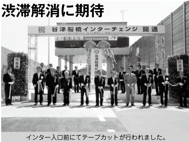
インター入口前にてテープカットが行われました。

習志野と船橋の両市を走る357号線と並行して走る東関東自動車道をつなぐ新たな出入り口「谷津船橋インターチェンジ」が9月20日(金)に開通しました。