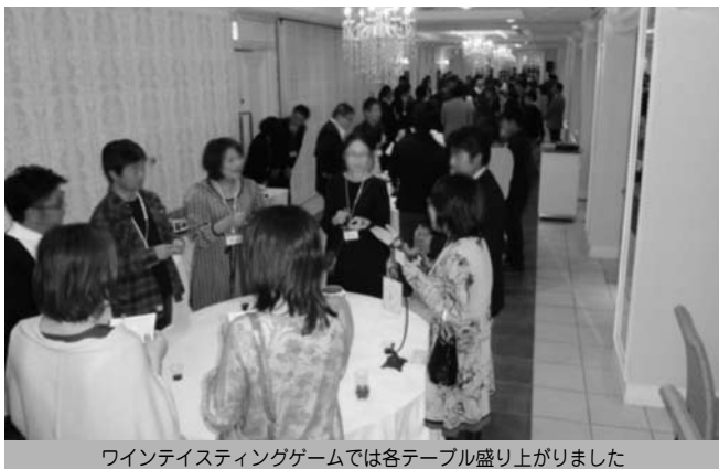
ワインテイスティングゲームでは各テーブル盛り上がりました

当日は応募多数のなか抽選で選ばれた70名の男女が参加し、ワインテイスティングゲームをはじめ、賑やかな雰囲気の中で、会話が弾み、7組のカップルが成立するなど出会いの場の創出となりました。