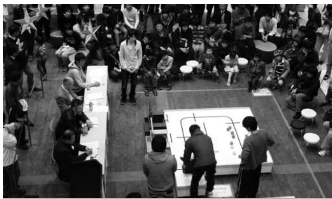
多くの来場者が訪れた知能ロボット競技