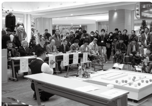
知能ロボット競技の様子

先端の「ものづくり」の成果を発信するとともに、イベントを通して未来の「ものづくり」を担う子どもたちの育成を目的に開催している「先端ものづくりチャレンジ イン 習志野」を12月14日(日)に千葉工業大学、NPO国際ロボフェスタ協会との共催で開催しました。