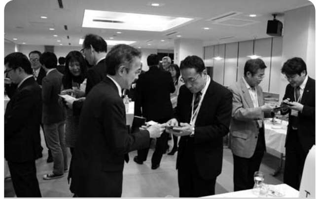
交流会では、親睦を深めるよい機会となりました

総会終了後には、役員議員・会員交流会が開催され、有意義な交流を図る機会となりました。