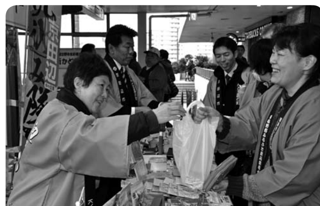
賑わう各地の特産品コーナー

習志野市の玄関である津田沼から地元の活性化事業を行い、習志野の情報や魅力を発信しました。習志野市の友好都市である南房総市、山梨県富士吉田市、群馬県上野村、京都府京田辺市の特産品と習志野市のふるさと商品の販売を行った「友好都市観光交流展」、ステージイベントでは習志野市にゆかりのある音楽家の演奏を行った「ならしの街かど音楽会」のほか、「習志野街かど写真展」、「新京成電鉄記念撮影会」、オービックシーガルズによる「アメフト体験コーナー」など、様々な催しが行われ会場は賑わいました。