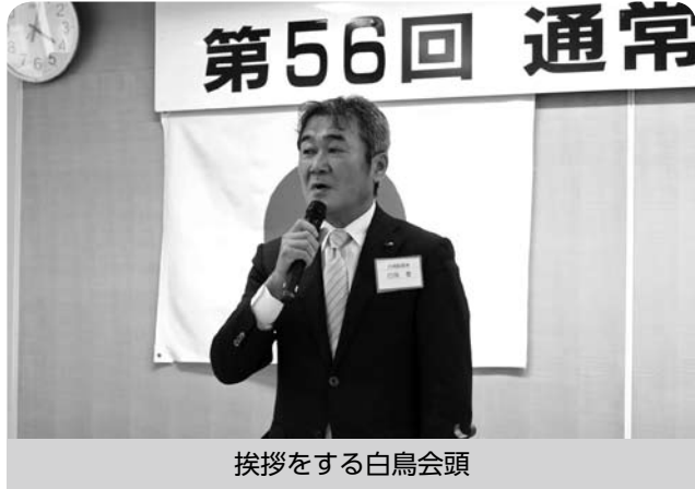
挨拶をする白鳥会頭