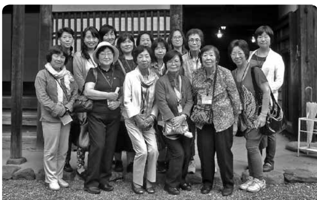
国指定重要文化財 旧黒澤住宅前

習志野市が健康なまちづくりにおける相互応援に関する協定を締結している上野村を訪問し、村の自然豊かな地域資源を活かした健康づくり事業を視察。関東最大級の鍾乳洞の不二洞や、きのこセンターの見学、森林セラピーを体験しました。上野村の大自然にふれるとともに地場産品を使用した料理をいただき、上野村の温泉郷のやまびこ荘や、しおじの湯のやさしい泉質の温泉でリラックスするなど、上野村の極上の癒し体験プログラムを満喫しました。