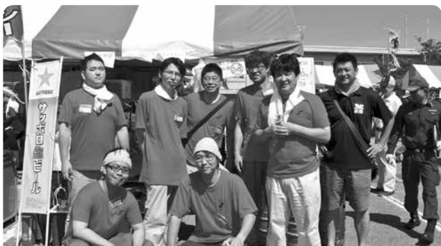
グルメコーナーへ出店した青年部

また、開催にあたりましては、景気厳しい折にもかかわらず、多くの会員事業所の皆様からのご協賛をいただきました。紙面を借りてお礼を申し上げます。