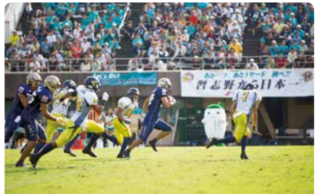
昨年の秋津サッカー場での試合