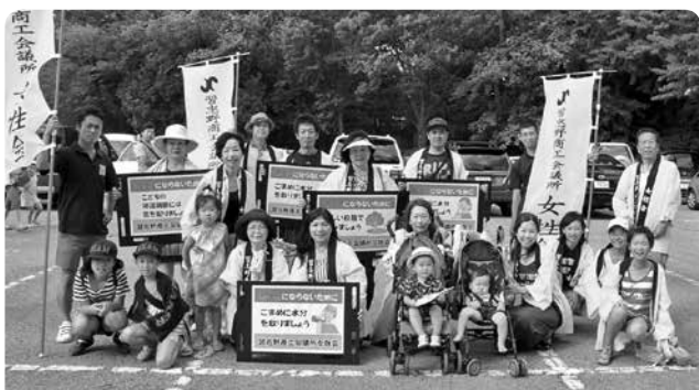
オープニングパレードへ参加した女性会