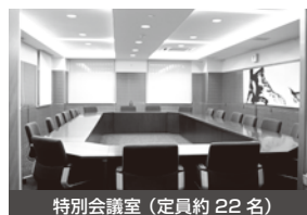
特別会議室(定員約22名)