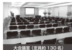
大会議室(定員約130名)