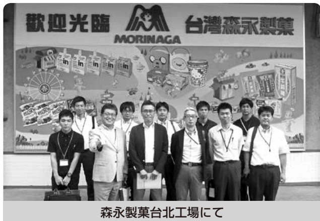
森永製菓台北工場にて

工業部会では、今後も地域の中小ものづくり企業の技術高度化と発展および将来の核たる若手経営者・後継者、幹部候補生等の人材育成に積極的に取り組んでいきます。