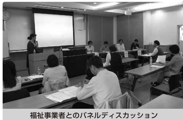
福祉事業者とのパネルディスカッション

講義を通して参加者の方々から「今後のビジョンがクリアになった」、「実際に現場を訪問し、それぞれの事業所の工夫、苦労などを感じることができた」などといった開業へ向けての前向きな意見をいただきました。今後も習志野商工会議所では創業志望者の育成を地域経済活性化の重点と位置付け、その支援に力を注いでいきます。