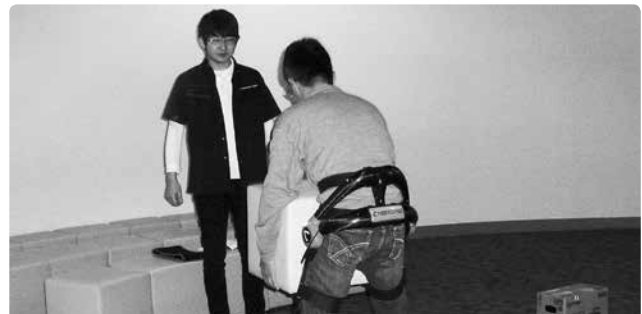
ロボットスーツ HAL を実際に体験