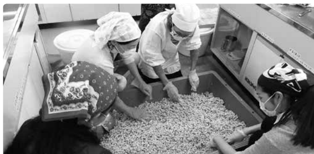
茹でた大豆の粗熱処理

身近な調味料である味噌を原材料から調理することによって、食の安心・安全を考え、見直す機会となりました。