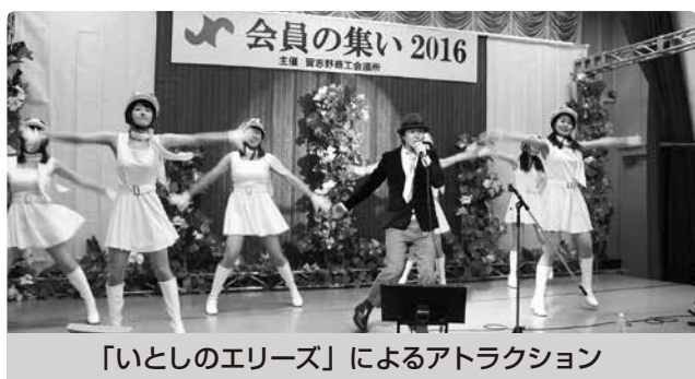
「いとしのエリーズ」によるアトラクション