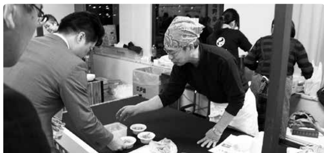
参加者で賑わう屋台ブース

会員事業所同士の交流をはじめ、新入会員の会議所事業への参加のきっかけとなる機会となりました。