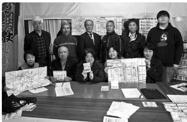
▲完成を喜ぶワイがや通り活性化委員会の皆さん

ワイがや通り活性化委員会では、習志野市市民参加型補助金を活用し、京成津田沼駅周辺の店舗約400店を掲載した「ワイがやマップ」を作成しました。マップを利用してワイがや通りを中心に周辺の地域活性化の一助となればとの思いが込められています。マップは掲載店舗をはじめ、市役所や公民館などにて配布しています。