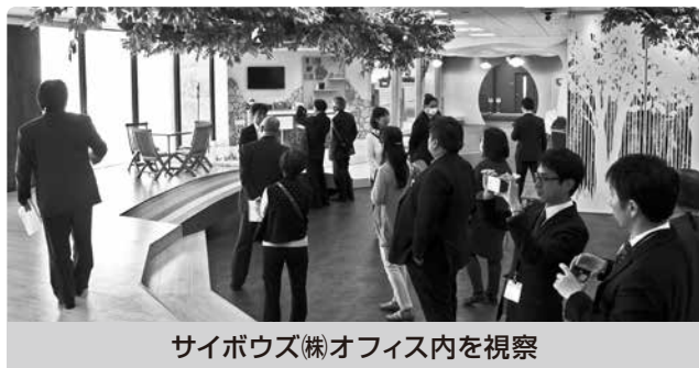
サイボウズ(株)オフィス内を視察

普段訪れることのできない先端IT企業を訪問し、自社の業務効率を図るIT化への取り組みに前向きになる有意義な研修となりました。