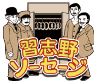
◆習志野ソーセージロゴ

現在、習志野ソーセージ普及推進委員会を立ち上げ、習志野市や製造会社などとレシピを考案し、当所会員事業所をはじめとする商店や大型店への販売協力依頼などを調整しています。