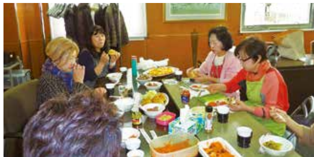
◆調理研究を行う女性会メンバー

当所女性会でも、調理研究会を立ち上げ、新たな調理方法を研究する取り組みを行っています。