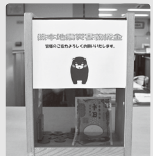
熊本地震災害 募金箱

習志野商工会議所では、被災された方々を支援するため、会館窓口に義援金受付のための募金箱を設置しました。今後、日本商工会議所等と連携し被災された方々の生活再建の支援に取り組んで参りますので、皆様のご理解とご協力をお願い申し上げます。