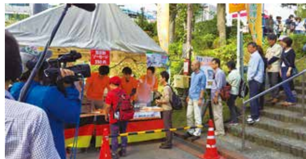
◆津田沼公園(モリシア前広場)にて開催