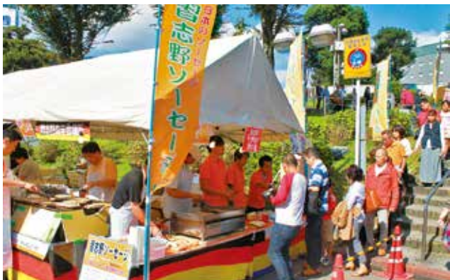
◆行列ができる習志野ソーセージブース。2日間で3000本が売れました。

習志野ソーセージの味を市民の方々に堪能してもらうため、市内各イベントなどへ模擬店を出店し販売を行っています。