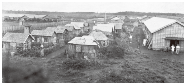
◆捕虜収容所バラックとラウベ

その捕虜収容所にいたドイツ兵が製造法を公開したことから、習志野市は、日本のソーセージ製造法伝承の地とされています。