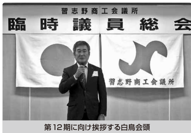
第12期に向け挨拶する白鳥会頭