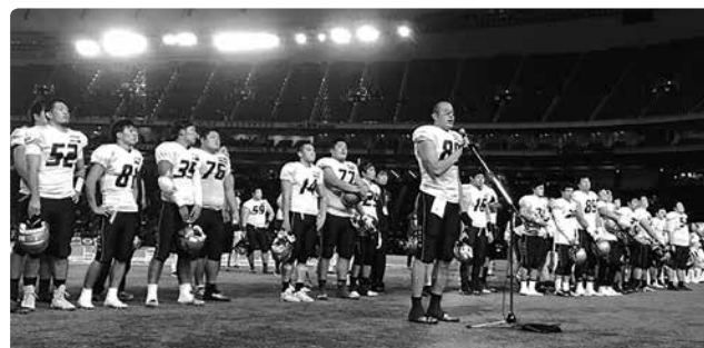
試合終了後、日本一奪回を誓う選手達

当日は、多くの方々に応援バスツアーにご参加いた だき心から感謝申し上げますとともに、本年もオービ ックシーガルズへの熱いご声援をいただきますようお 願いいたします。