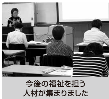
今後の福祉を担う 人材が集まりました

10月2日(日)～12月3日(土)までの全5日間、地域で福祉分野の独立・開業を志す方を支援する『ハッピー福祉起業塾』を開催し、15名の受講生が講座を修了しました。