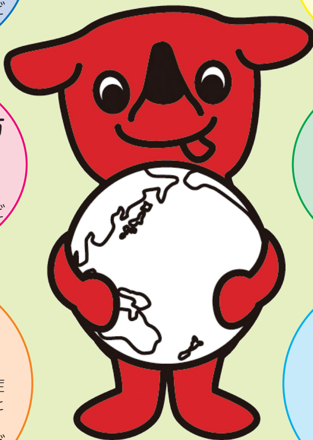
千葉県マスコットキャラクター 「チーバくん」